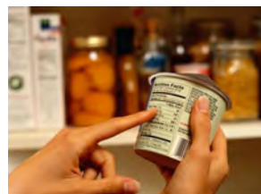
Rótulos en Brasil: Detalles que hacen la diferencia para el correcto ingreso de los productos a Brasil

kg. Para el caso de envases menores a 500g neto y superiores a 1 kg neto, no hay definición oficial de estándares, por lo que el formato de envases de comercialización de los mismos es libre.