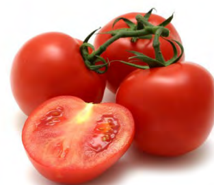
Variedades comercializadas en Brasil Saladete, Caqui, Santa Cruz, Italiano y Cereza

“Existe un aumento de la demanda por productos listos para consumo, entre ellos, la salsa de tomate, cuyo consumo aumentó en 55% entre 2002 y 2008”