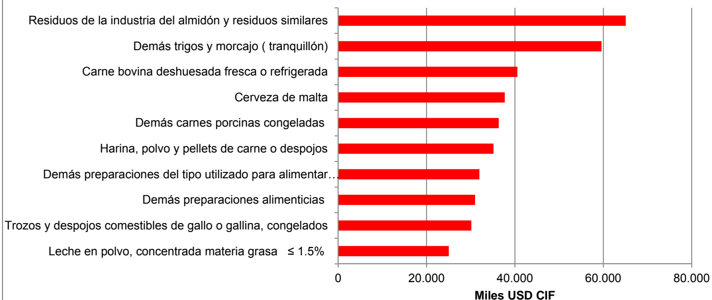
Gráfico 6. Principales importaciones silvoagropecuarias chilenas desde Estados Unidos, 2012