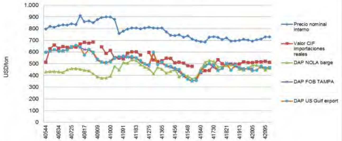
Figura 1 Evolución de precios mensuales de fosfato diamónico (DAP) (USD/ton) Enero 2011 a mayo 2015