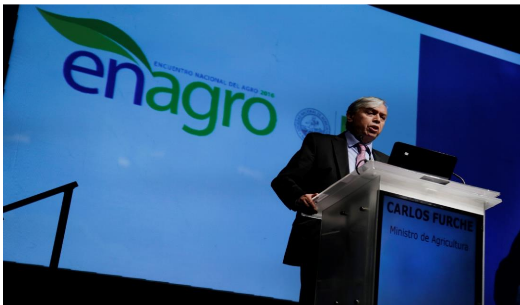
Imagen N° 1. Ministro Furche destaca sólidas bases de crecimiento agrícola y ejemplos de trabajo público-privado.

1.1. El 3 de octubre se realizó el XII Encuentro Nacional del Agro (Enagro) 2016, convocado por la Sociedad Nacional de Agricultura (SNA) bajo el eslogan “Semillas para buenas cosechas”. El presidente del gremio, Patricio Crespo, manifestó que “Chile es de todos y todos tenemos la responsabilidad de ayudar a sembrar buenas semillas y arar la tierra de modo de obtener una buena cosecha”, agregando que “sólo a partir de diagnósticos reales, con políticas públicas técnicamente bien hechas y con un diálogo franco, Chile podrá retomar la senda del progreso para todos”.