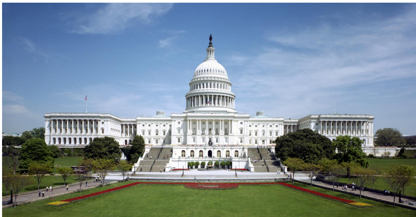
Imagen N°1. El Capitolio, Sede del Congreso de los Estados Unidos de América.