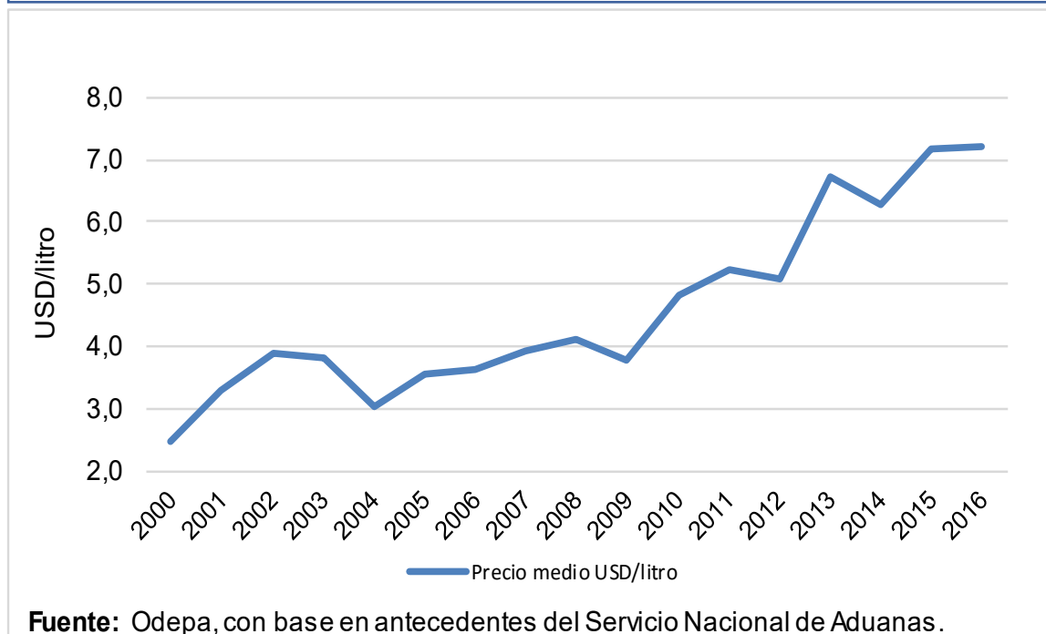
Gráfico 3. Precio medio de las exportaciones de pisco chileno.

el promedio del último período. Por otro lado, en términos de valor se aprecia una expansión importante desde el año 2009.