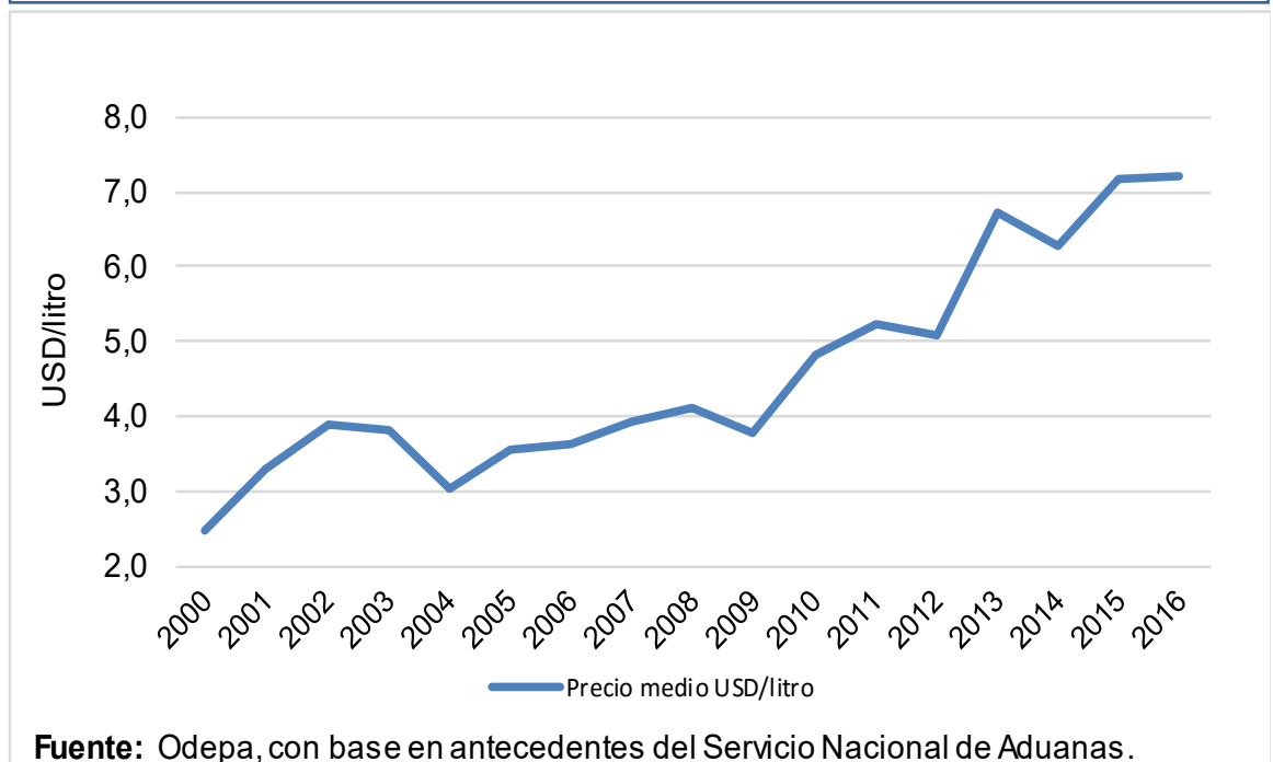
Gráfico 3. Precio medio de las exportaciones de pisco chileno.

el promedio del último período. Por otro lado, en términos de valor se aprecia una expansión importante desde el año 2009.