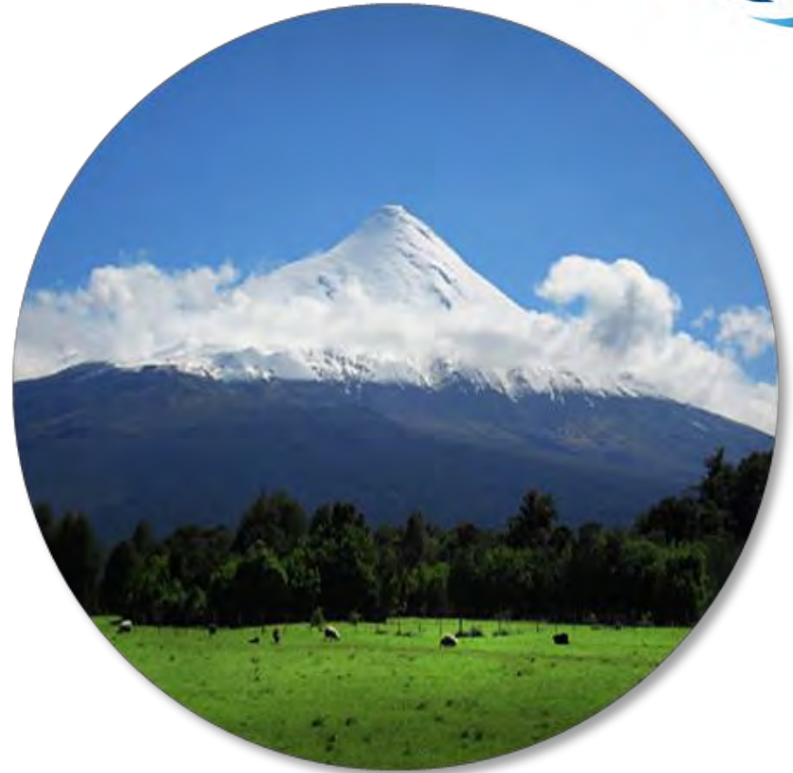
Volcán Osorno - Chile