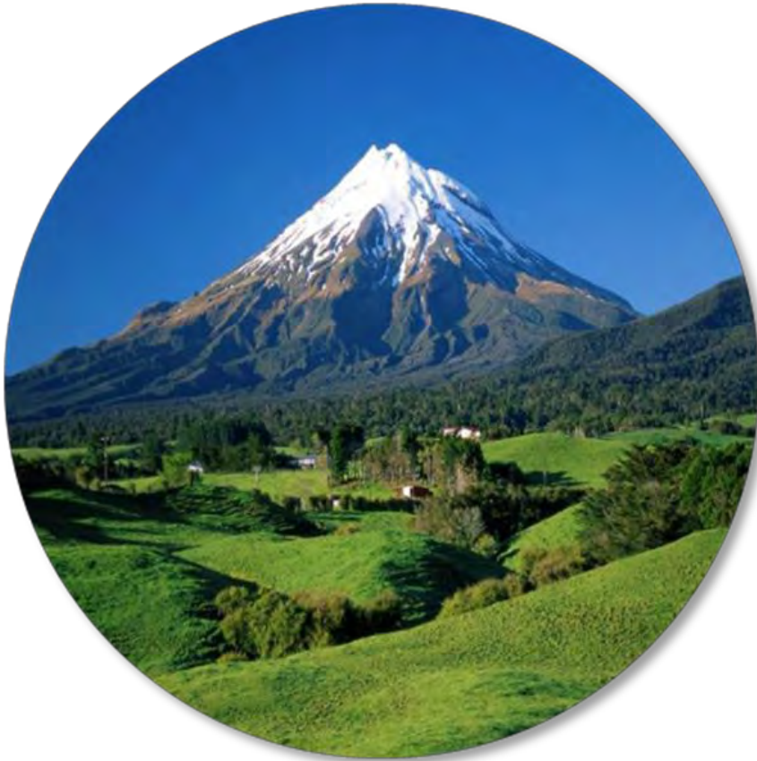
Cerro Taranaki – Nueva Zelandia