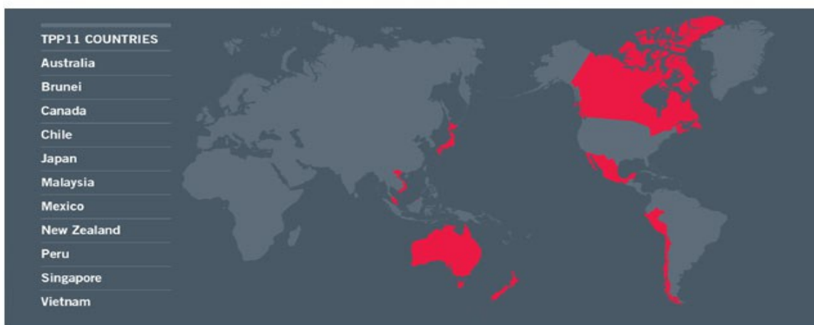
Figura 2. Países firmantes del TPP (11)