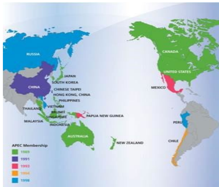
Figura 1. Economías miembros del Foro APEC