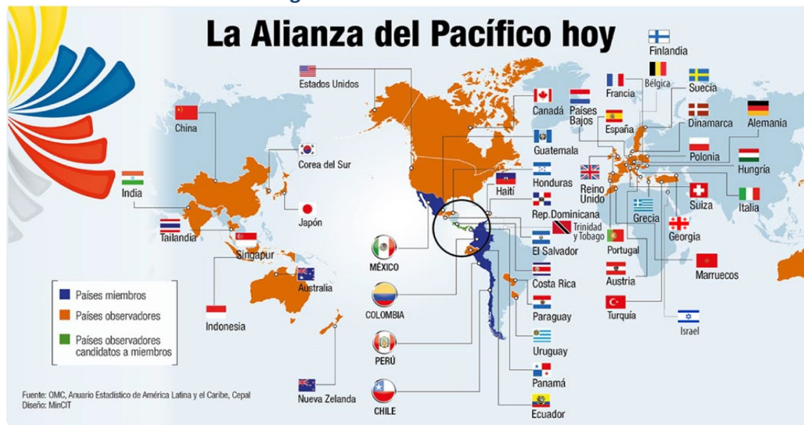
Figura 3. Alianza del Pacífico

https://andina.pe/agencia/noticia-alianza-del-pacifico-datos-y-cifras-este-bloque-integracion-regional-672898.aspx