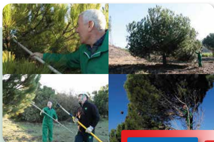
COSECHA MANUAL PINO PIÑONERO