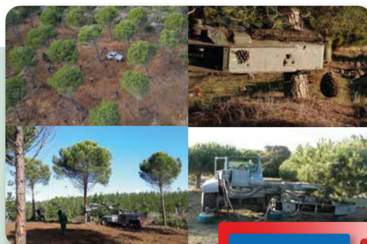
COSECHA MECANIZADA PINO PIÑONERO